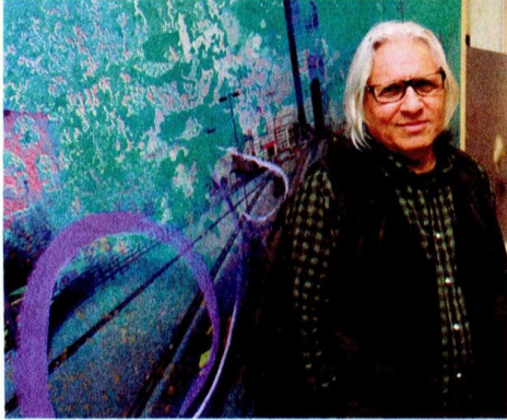
Sanatçının 14 yeni yağlıboya eserinden oluşan sergi, 31 Mart'a kadar Selçuk Yaşar Resim Müzesi ve Sanat Galerisi'nde sanatseverlerin ziyaretine açık olacak.

imgeleri yanı sıra özünden yitirmeksizin her dönem gelişim gösteren özgün paletiyle de, çağdaşları arasında Türk resim sanatının yetkin ismi "firçası" olarak ışıldar" değerlendirmesinde bulundu.