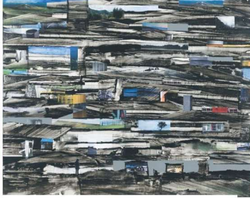
Semih Çınar'ın "Atık No 1" (sağda) adlı eseri Özgün Baskı dalında DYO Sanat Ödülü'ne layık bulundu. Sanatçılar ödülleri Feyhan Yaşar'ın elinden aldılar.